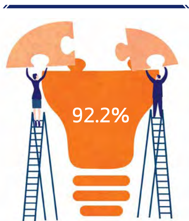
技术性综合赔付率

2014年，鼎睿也通过增强信用和保证保险以及人寿再保险的承保能力，进一步推动了产品多元化。到2014年底，财产险再保险业务仍占总业务组合的43.9%，车险次之，其占比降低逾10个百分点，至30.0%。2014年，公司的农险业务占比从5.4%增值12.5%，而意外伤害险从不到3%增至近10%。